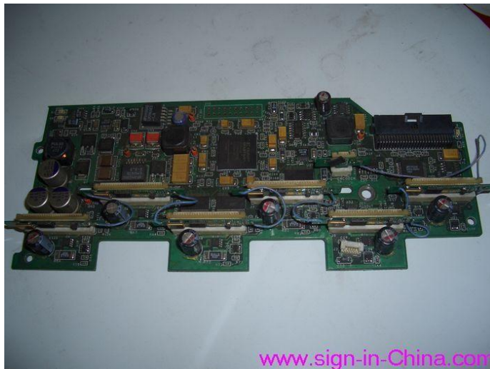
placa de cartucho com decodificador