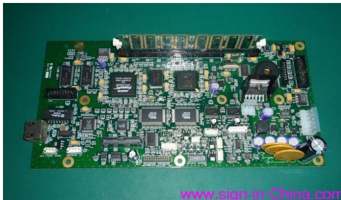
placa principal 1000I 1200I